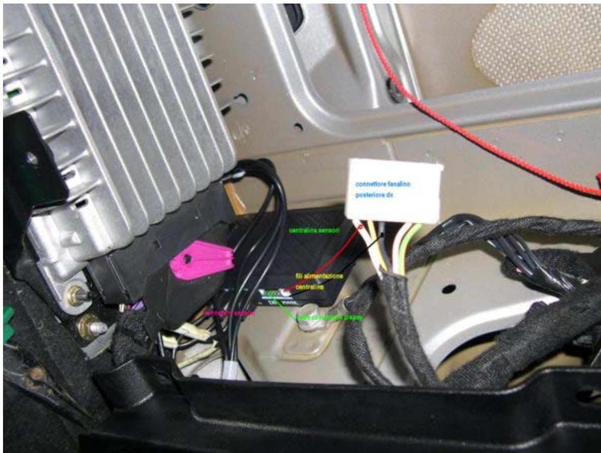
sopra: centralina sensori