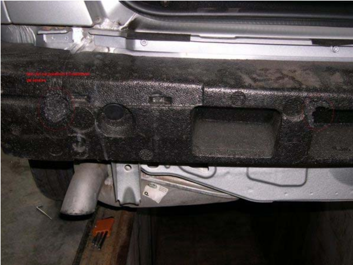
sopra : praticare i fori sul polistirolo per l'inserimento dei sensori