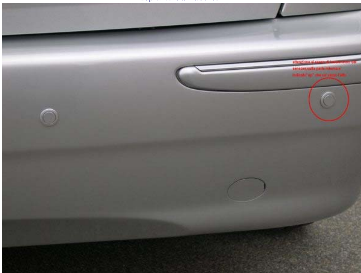
sopra: attenzione al senso di inserimento, nella parte interna "UP" indica che va verso l'alto